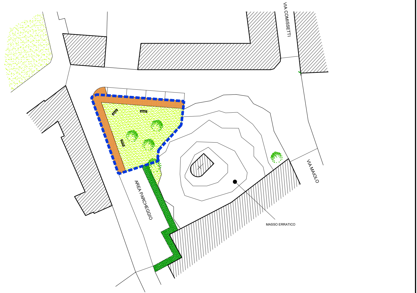
PLANIMETRIA GENERALI DELLE AREE IN PROGETTO DI VIA MASSO GASTALDI N.20 Scala 1:500