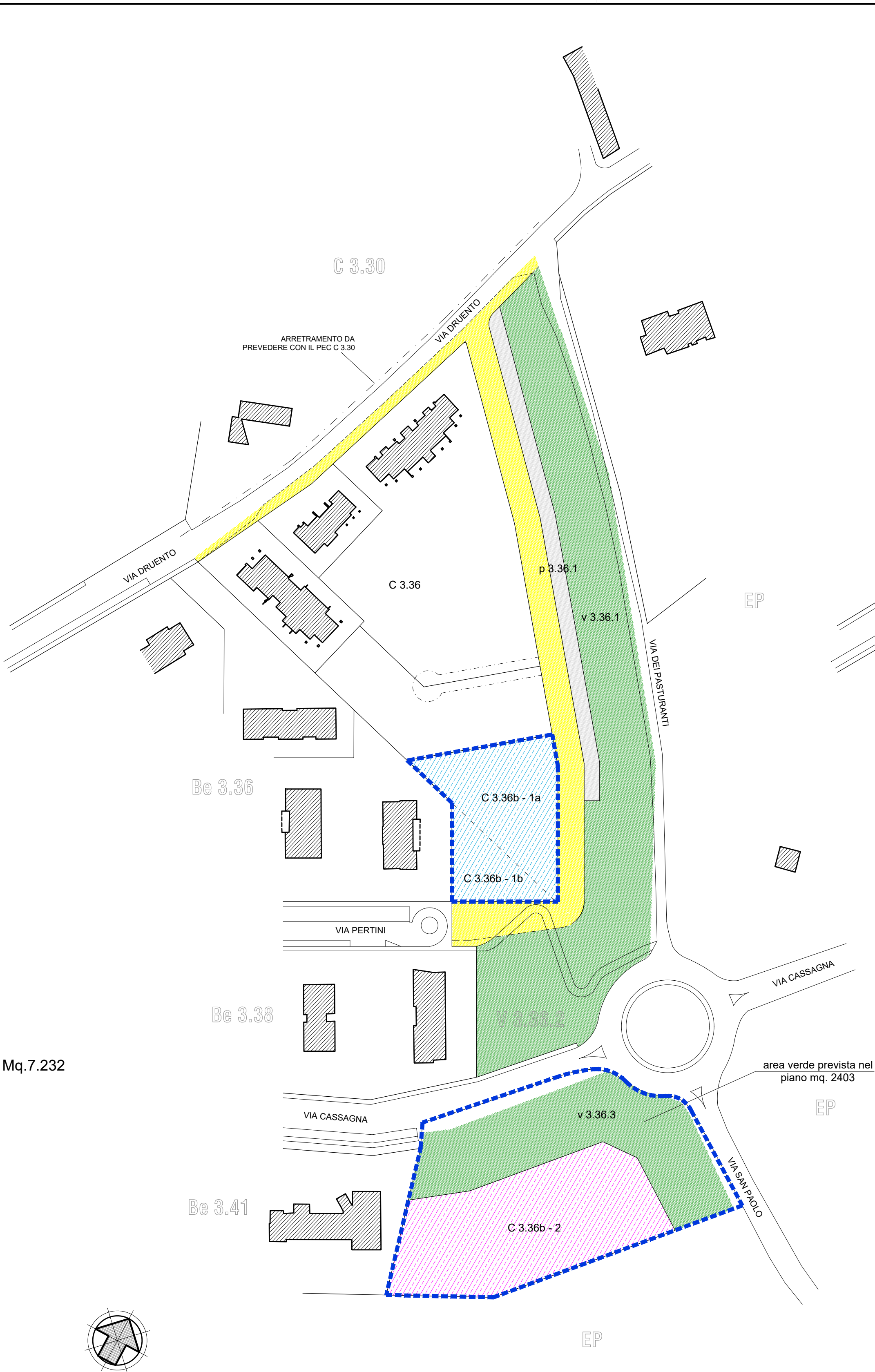
PLANIMETRIA GENERALI DELLE AREE COME DA P.R.G.C. Scala 1:1000