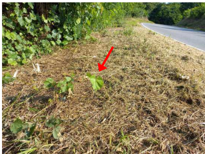
RICACCI DI VITE INSELVATICHTA

Partenza: AOO A1700A, N. Prot. 00008135 del 16/04/2026