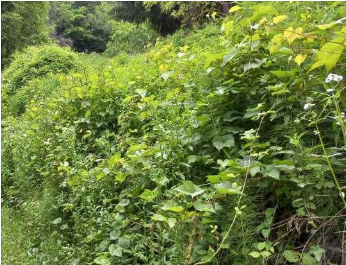
FOTO 4 - Cespugliosa