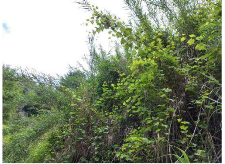
FOTO 5 - Rampicante

Partenza: AOO A1700A, N. Prot. 00008135 del 16/04/2026