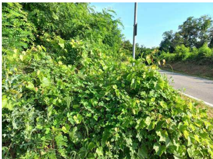
PORTAMENTO CESPUGLIOSO DI VITE INSELVATICHTA, A RIDOSSO STRADA, CHE TENDE A INVADERE SEGNALETICA STRADALE