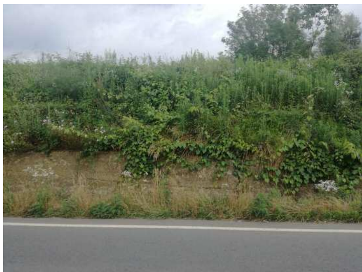
PORTAMENTO VITE INSELVATICHTA SU MURO