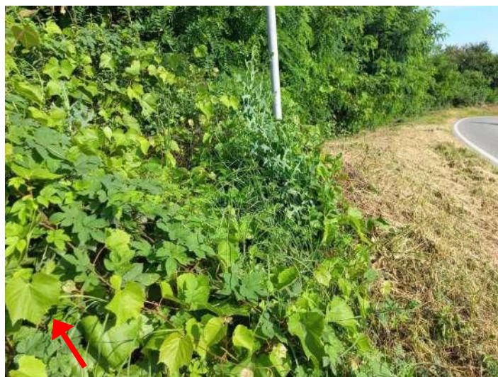
PORTAMENTO DELLA VITE E DETTAGLIO FOGLIA